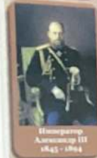
Император Александр III 1845 - 1894

Самый короткий царствование в истории России. Александр III был последним императором династии Романовых. Он продолжил политику своего отца Александра II, но в отличие от него не проводил реформ. Его правление было отмечено усилением авторитаризма и консерватизма. В 1891 году он объявил о начале строительства Транссибирской железной дороги, что стало важным шагом в развитии страны.