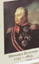
Михаил Кутузов 1747 - 1813