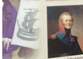
Александр I Романов 1777 - 1825