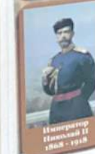
Император Николай II 1868 - 1918

Никита Хрущев был первым секретарем ЦК КПСС. Его правление было отмечено началом «оттепели», что привело к ослаблению цензуры и росту демократии. Он проводил политику «мирного сосуществования» с Западом. В 1956 году он объявил о начале строительства Транссибирской железной дороги, что стало важным шагом в развитии страны.