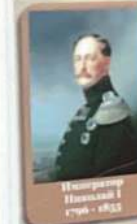
Император Николай I 1796 - 1825

Николай I был последним императором династии Романовых. Его правление было отмечено усилением авторитаризма и консерватизма. Он проводил политику «железного занавеса», что привело к росту недовольства в обществе. В 1855 году он объявил о начале строительства Транссибирской железной дороги, что стало важным шагом в развитии страны.