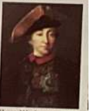
Александр I 1801-1825