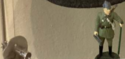
★ Сержант инженерных частей РККА в полевой форме 1941-1943 годы.

Остроконечный шлем, ставший знаменитой буденовкой, были придуманы художником Васнецовым, автором знаменитых картин «Три богатыря», «Витязь на распутье» и других. С тех пор богатырский шлем Васнецова, дополненный большой двоякой звездой, стал символом революции.