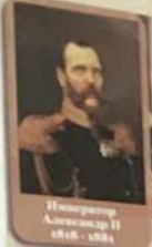
Император Александр II 1818 - 1881