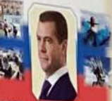
В.В. Путин 1952 - 2008

Россия на новом пути. Развитие страны в XXI веке. Укрепление позиций на мировой арене. Реализация национальных проектов. Развитие экономики и культуры. Улучшение качества жизни населения. Укрепление международных связей. Развитие науки и техники. Улучшение экологии. Развитие спорта и культуры. Улучшение образования. Развитие здравоохранения. Развитие социальной защиты населения. Развитие жилищно-коммунального хозяйства. Развитие транспорта. Развитие связи. Развитие информационных технологий. Развитие туризма. Развитие сельского хозяйства. Развитие промышленности. Развитие строительства. Развитие энергетики. Развитие транспорта. Развитие связи. Развитие информационных технологий. Развитие туризма. Развитие сельского хозяйства. Развитие промышленности. Развитие строительства. Развитие энергетики.