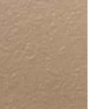
Петр III Фёдорович 1762-62