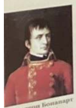
Наполеон Бонапарт 1769 - 1821