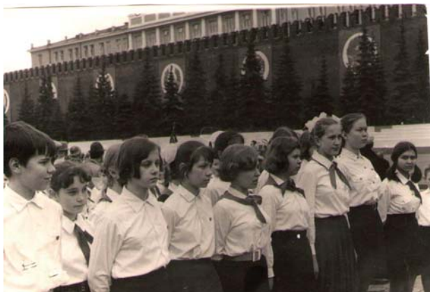
25.04.1970. Вступление в комсомол на Красной площади