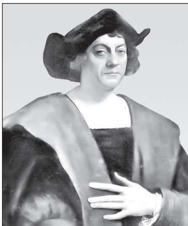
Возможный посмертный портрет Христофора Колумба. Художник С. дель Пьомбо. 1519 г.

(Слышится шум моря. На экране демонстрируется видеоролик: от причала отходит старинный парусный корабль.)