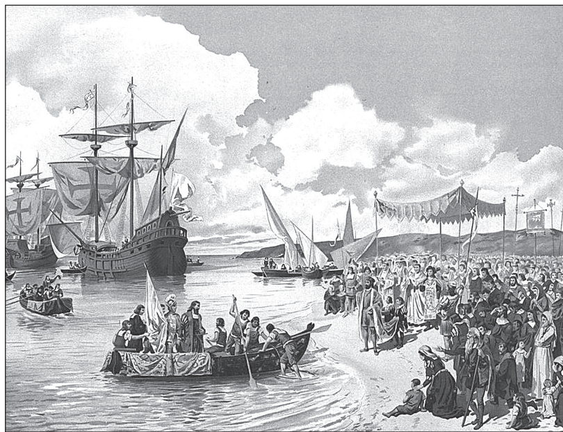
Отплытие Васко да Гамы в Индию в 1497 году. Художник А.Р. Гамейро. 1900-е гг.

10 Их завезли колонисты из Европы, из-за чего погибли сотни жителей островов.