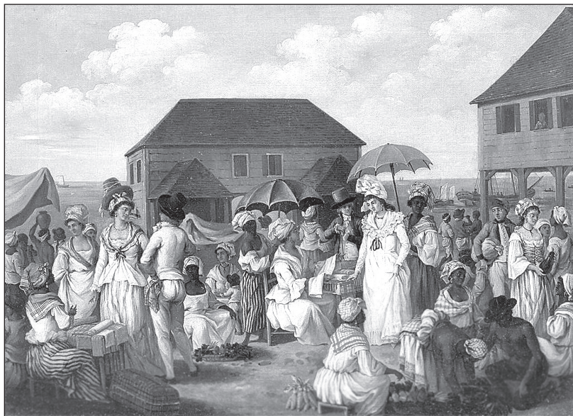
Льняной рынок на Доминике. Художник А. Бруниас. 1780-е гг.