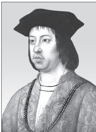
Король Фердинанд II Арагонский. Художник. М. Зиттов. Конец XV в.

6 В феврале 1504 г. мореплаватель был у берегов Ямайки. Его корабли сели на мель, во многих были течи, паруса имели сильные повреждения. Матросы болели, провизия заканчивалась, надвигался голод. Поначалу местные жители охотно делились едой с попавшими в тяжёлое положение моряками. Но вскоре островитянам надоело помогать чужеземцам. Заставить индейцев опять слушаться испанцев могло лишь какое-нибудь необыкновенное событие. Но вскоре находчивый Колумб нашёл выход! А помогли ему астрологические таблицы. Что же произошло?