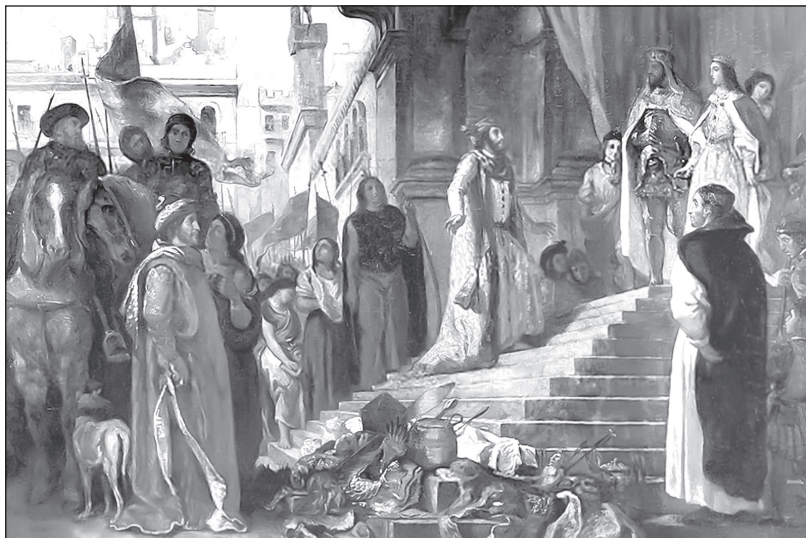
Возвращение Христофора Колумба. Художник Э. Делакруа. 1839 г.

и очень полезный. В мякоти содержатся каротин, витамины С, В 1 , В 2 , В 6 . Ацтеки называли его айотли или йэаотли, варили, тушили, а некоторые разновидности употребляли в сыром виде.