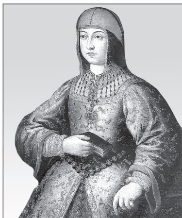
Королева Изабелла Кастильская. Неизвестный художник. 1460-е гг.

5 В третьей экспедиции Х. Колумб решил направиться южнее, чем в прошлый раз. Он думал, что золото можно найти ближе к экватору. Около острова Йерро (из числа Канарских) адмирал разделил свою флотилию. Три корабля поплыли прямо к Эспаньоле, а на трёх дру-