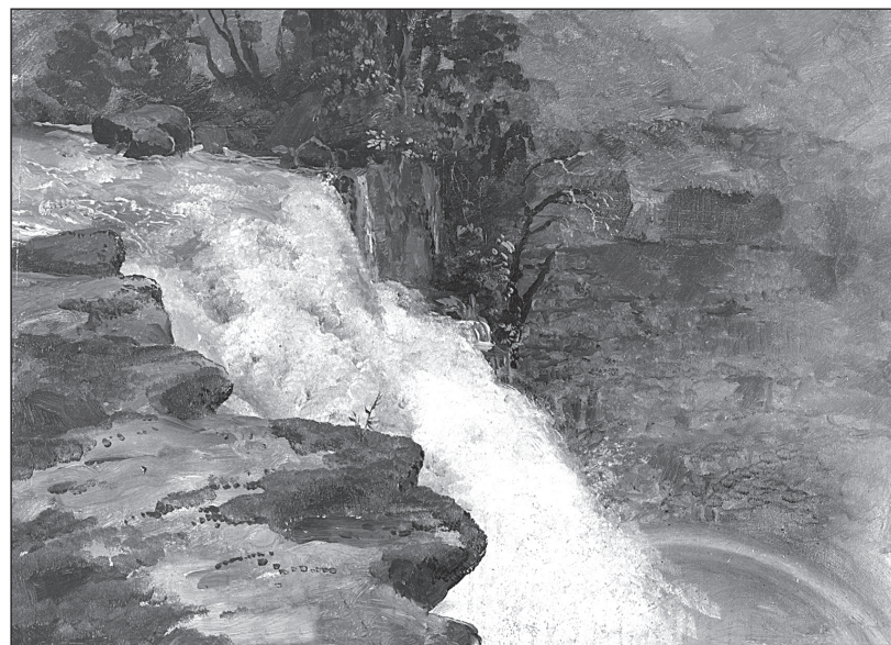
Водопад в Колумбии. Художник Ф.Э. Чёрч. 1853 г.

6 В феврале 1504 г. мореплаватель был у берегов Ямайки. Его корабли сели на мель, во многих были течи, паруса имели сильные повреждения. Матросы болели, провизия заканчивалась, надвигался голод. Поначалу местные жители охотно делились едой с попавшими в тяжёлое положение моряками. Но вскоре островитянам надоело помогать чужеземцам. Заставить индейцев опять слушаться испанцев могло лишь какое-нибудь необыкновенное событие. Но вскоре находчивый Колумб нашёл выход! А помогли ему астрологические таблицы. Что же произошло?